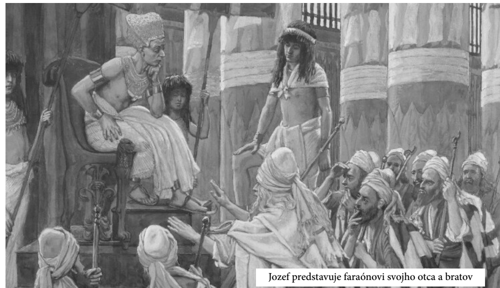
Jozef predstavuje faraónovi svojho otca a bratov

Pod mocou Jakubových úprimných slov sa mení srdce faraónovo. Akoby zahorela